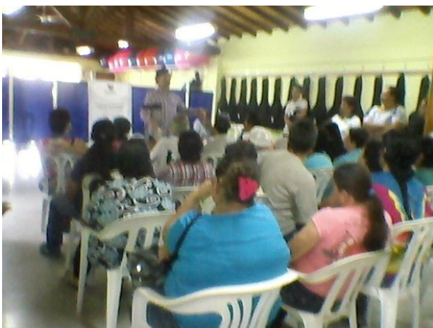
Gente beneficiada y llamada para el proyecto de prótesis removibles, sala de espera del salón social "años felices" barrio Téjelo, día 12 de febrero del 2014