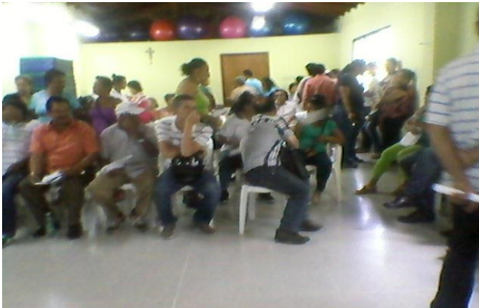
Sala de espera salón social "años Felices", gente convocada inscripta beneficiada por el proyecto Prótesis Removibles.