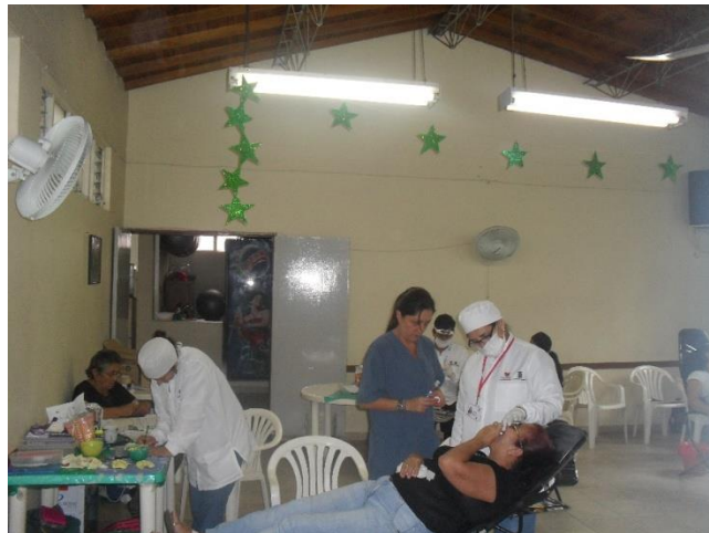
Sala de valoración del paciente