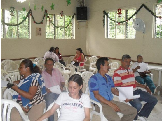
Sala de espera de los beneficiados 21 de enero 2014