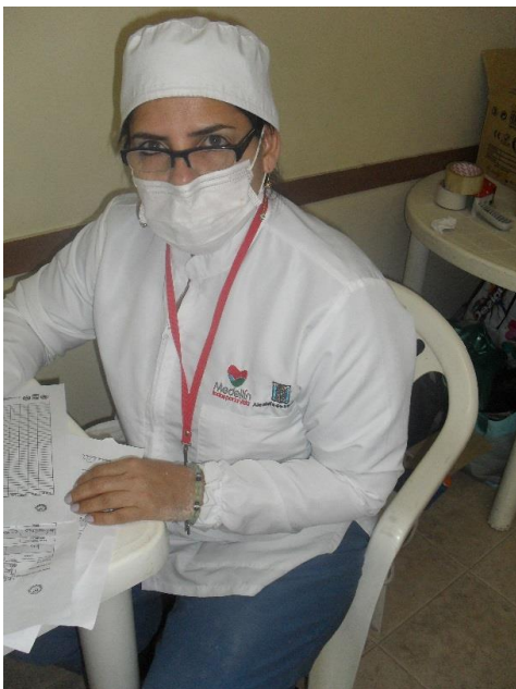
Una de las odontólogas en cargadas de la valoraciones a los pacientes con su presentación personal